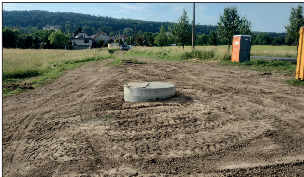
KANALIZACE A ŽLAB. Oprava kanalizace a instalace Parshallova žlabu pro měření průtoku splaškové vody – květen a červen 2023.