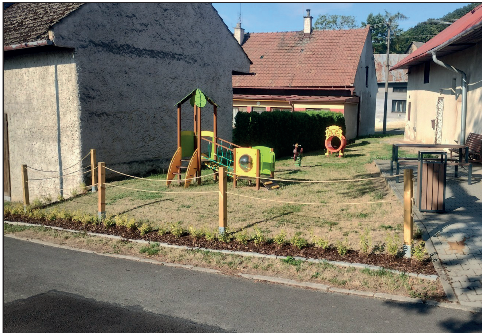
TUPECKÉ HRŠTĚ. Výsadba a oplocení hřiště v Tupci a doplnění houpačky.