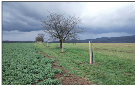
VÝSADBA NOVÉ OVOCNÉ ALEJE. Fotografie k textu z úvodní strany.