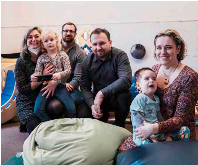
Ministr práce a sociálních věcí na setkání s rodiči hendikepovaných dětí.