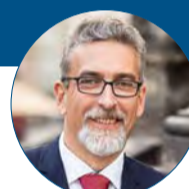
Miroslav Žbánek primátor města Olomouc

Ve Šternberku koordinujeme pomoc lidem z Ukrajiny po dohodě s krizovým štábem Olomouckého kraje. Veškeré nabídky ubytování, hmotné pomoci směřujeme do centrální evidence na krizový štáb. Město připravilo a s pomocí darů spoluobčanů, Charity apod. vybavilo zatím 4 byty pro uprchlíky z Ukrajiny. Byty obsazujeme po dohodě s krizovým štábem. Od úterka 8. března jsou již 2 byty obsazeny a nyní očekáváme další ukrajinské rodiny. Jde o rodiny, které měly cíleně zájem o pobyt ve Šternberku. Ve městě působí také další organizace např. Charita, která organizuje materiální pomoc, Dětský klub Eccáček, z.s., nabízí prostory své herny pro využití maminek s dětmi. Pomoc organizují také občané města, ať již poskytnutím ubytování, nebo finanční či materiální podporou. Děti, které přišly do Šternberka společně s maminkami, se budou postupně začleňovat v našich mateřských a základních školách a volnočasových zařízeních.