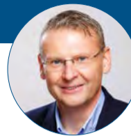
Petr Měřínský primátor města Přerova

Do této chvíle se ruská agrese na Ukrajinu do chodu města příliš nepromítla. Ukrajinské rodiny, jež k nám zatím přišly, zde většinou mají vlastní zázemí. S našimi partnery nabízejícími ubytování se ale připravuje na příchod lidí, kteří budou potřebovat větší pomoc. Už dopředu se snažíme nastavit nějaké procesy, abychom mohli pomáhat rychle a efektivně. Také se na nás obrátilo naše ukrajinské partnerské město Dubno s prosbou o konkrétní materiální pomoc. Vyhlásili jsme proto sbírku zdravotnického materiálu a dalších potřeb, k tomuto účelu jsme také zřídili transparentní účet.