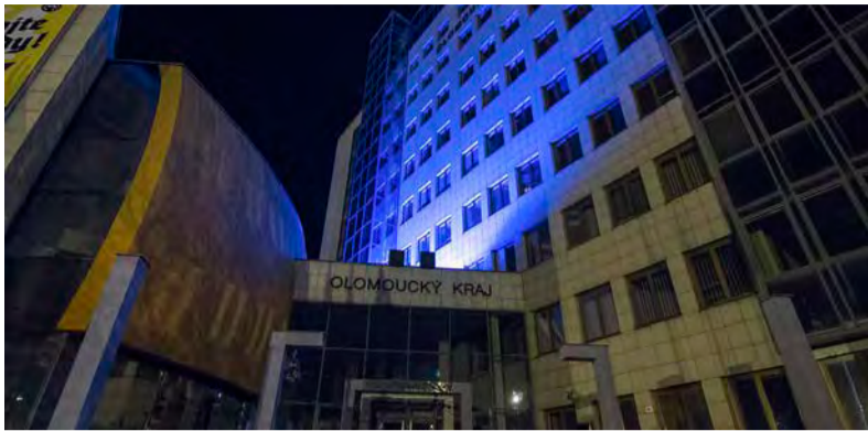
Olomoucký kraj se i letos zapojí do projektu Česko svítí modře. Ten upozorňuje na problémy lidí s autismem a jejich rodin. Budova krajského úřadu v Olomouci se proto v noci z 2. na 3. dubna rozsvítí modře.