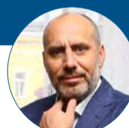
František Jura primátor statutárního města Prostějova

Už v době, kdy situace eskalovala v diplomatické rovině, jsme jako město vyjádřili Ukrajině podporu. Po vypuknutí války jsme navázali kontakt s městem Černivci na jihozápadě Ukrajiny a zorganizovali jsme sbírku materiálu podle jejich požadavků. Ke sbírce jsme přidali další potřebné věci, jako zdravotnický materiál, dalekohledy či termovize, a na ně jsme uvolnili z rozpočtu města 1,5 milionu korun. Chystáme další sbírku různých zařízení pro civilní ochranu města Černivci. V evakuačním centru na Tererově náměstí jsme připravili zázemí pro přechodné ubytování stovky lidí a další asi tři desítky míst jsme vytvořili v azylovém domě pro ženy a matky s dětmi. Oběma těmito zařízeními už prošly desítky žen s dětmi. Jsme připraveni pomáhat dál, události nasvědčují tomu, že ta hrozná situace hned tak neskončí.