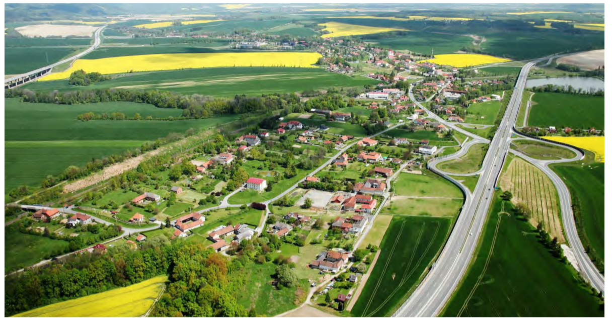
Zatím posledním vítězem krajského kola soutěže se v roce 2019 stala obec Běloutín.