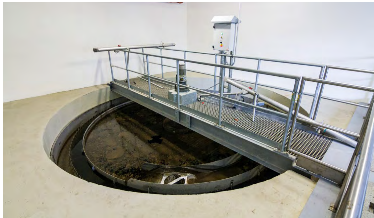
Hejtmanství uvolní peníze na podporu výstavby čistíren odpadních vod, vodovodů a kanalizací, ale i na stavby poldrů či založení studánek.

padních vod nebo na obnovu environmentálních funkcí krajiny, tedy především na obnovu